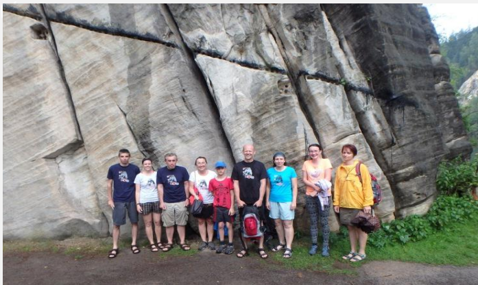
LÉTO BUDIŽ POCHVÁLENO ZMOKLÍ, ALE S NOVÝMI TRIČKY